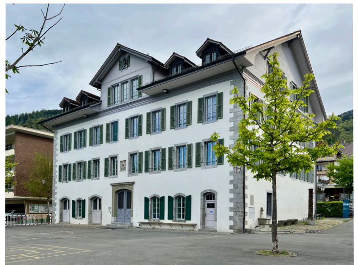
Das Schulhaus, optisch praktisch unverändert.