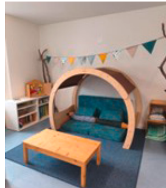
Kindergerecht und bunt.

Schulleitung Zyklus 1 Schulverband Hilterfingen und Lehrpersonen Schulhaus Seeplatz