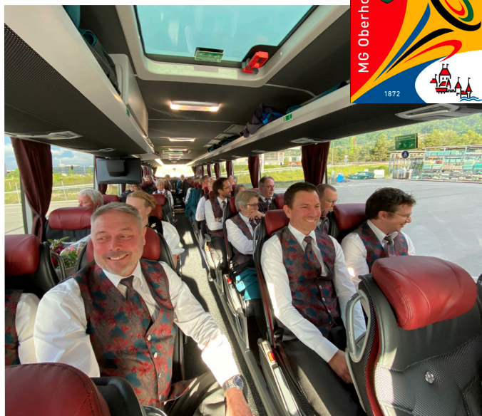
Gute Geselligkeit gehört dazu und ist wichtig.