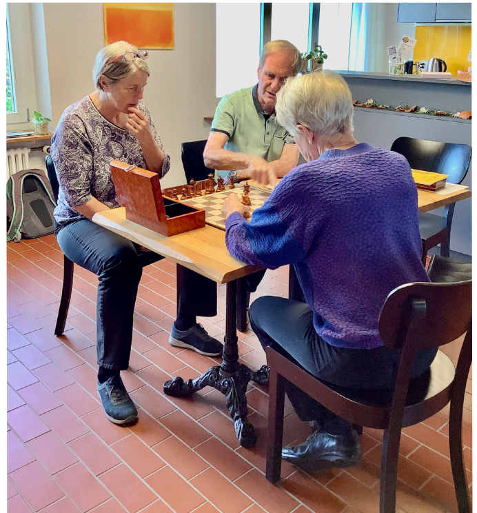
Schachspiel zur Geselligkeit und als Gedächtnistraining.

Nach dem erfolgreichen Versuch im Jahr 2025 wird es auch in diesem Jahr wieder eine Generationen-Disco geben! Am Freitag, 14. August, lädt der Generationenrat zusammen mit dem Alterszentrum Seegarten zum zweiten Mal zu Tanz und Geselligkeit ein. Ab 18.08 Uhr sind nicht nur Hits aus den 80er- und 90er-Jahren mit DJ Schwinä, sondern auch feine Snacks und Getränke im Angebot. Eine grossartige Gelegenheit, in einer wirklich gemischten Gruppe verschiedener Generationen zu feiern.