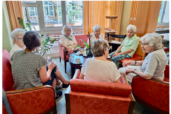
Frauen genossen im Seniorama das gemeinsame Beisammensein beim Kaffeekränzchen.