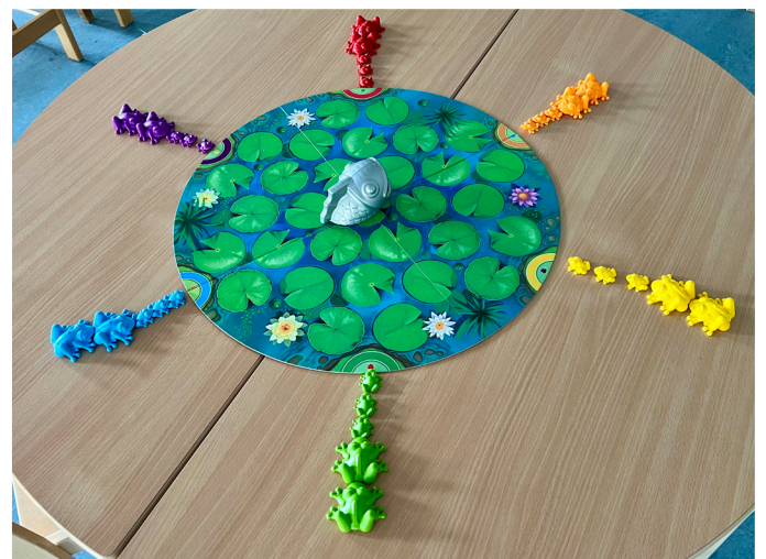
Was erwartet wohl diese Froschfamilien?