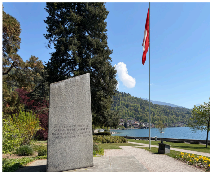
Die Churchill-Gedenkstätte in Oberhofen.

Die Initiative für diese Ehrerbietung an Sir Winston Churchill stammt von der Schweizerisch-Britischen Gesellschaft. Nachdem Genf, Luzern und Oberhofen als Standorte zur Auswahl standen, entschied sich der Vorstand für unser Dorf. Den Auftrag erhielt der Bildhauer Gustave Piguet (1909–1976). Die Form des Steins soll an das Victory-Zeichen erinnern. Dieses formte Churchill mit zwei Fingern bei seinen Auftritten während der dunkelsten Zeiten des Krieges, um seinem Volk Mut zu vermitteln. Der Granit aus den Schweizer Alpen schafft eine Verbindung