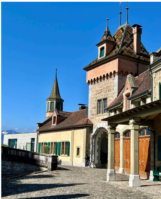
Der Eingangsbereich des Schlosses.

Nach der Dämmerung schaltet die vorprogrammierte Beleuchtung automatisch ein und lässt die Architektur des Schlosses optimal zur Geltung kommen. Auch das Spielen mit neuen Farbtönen für besondere Anlässe ist möglich. Das Lichtkonzept wurde durch Bernhard Bühlmann von ERCO lighting gestaltet, für die Projektleitung war Heinz Niederhäuser vom Schloss Oberhofen zuständig. Ohne das Sponsoring von «Kommunikation Oberhofen» (früher Kabelfernsehverein), hätte das Projekt jedoch nicht realisiert werden können. Im Namen der Stiftung danken wir für die grosszügige Unterstützung ganz herzlich!